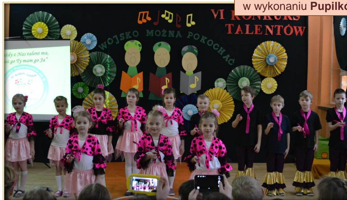
Mini musztra wojskowa w wykonaniu Pupilków.